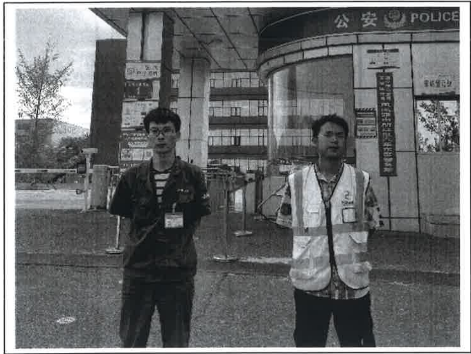
现场监测人员与企业陪同人员留影