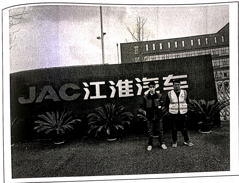
现场监测人员与企业陪同人员留影